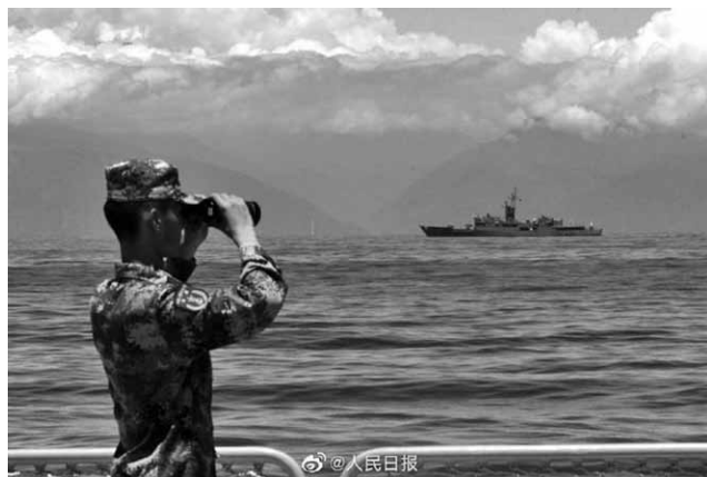
圖3 解放軍於8月5日發布的「解放軍軍艦靠近台灣東部海岸」圖

中共戰略支援部隊在其公眾號指稱，經由國際社會、軍事、地圖與民眾等視角，中共軍演深刻彰顯捍衛「一個中國」意涵。 50