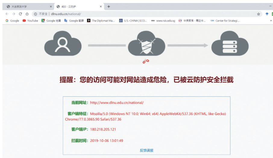
圖 2 大連民族大學東北少數民族研究院網站查詢結果

驗室等研究單位， 112 如欲進一步檢索前述研究者資料，點選進入研究單位網頁時，則遭攔截無法讀取（請見圖 2）。